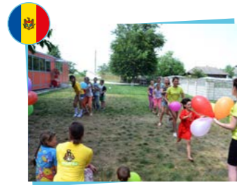
Concordia Association de football de Moldavie