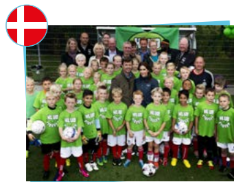
The Mary Foundation Association danoise de football