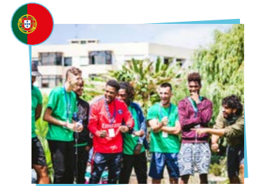
CAIS Associação de Solidariedade Social Fédération portugaise de football