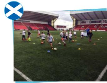
The Scottish Football Partnership Trust Association écossaise de football