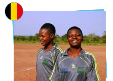
Plan Belgique Union Royale Belge des Sociétés de Football Association