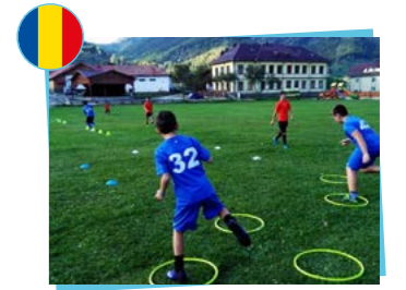
Policy Center for Roma and Minorities Fédération roumaine de football