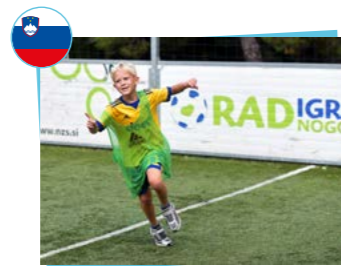
Youth health and Summer resort Debeli Rtic Association slovène de football