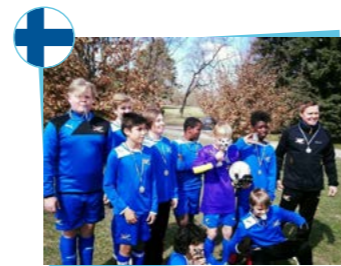
Icehearts of Finland Association finlandaise de football