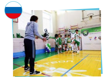
Football for kids Union russe de football