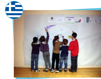
Mazi gia to Paidi Fédération hellénique de football