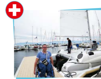
Just for Smiles Association suisse de football