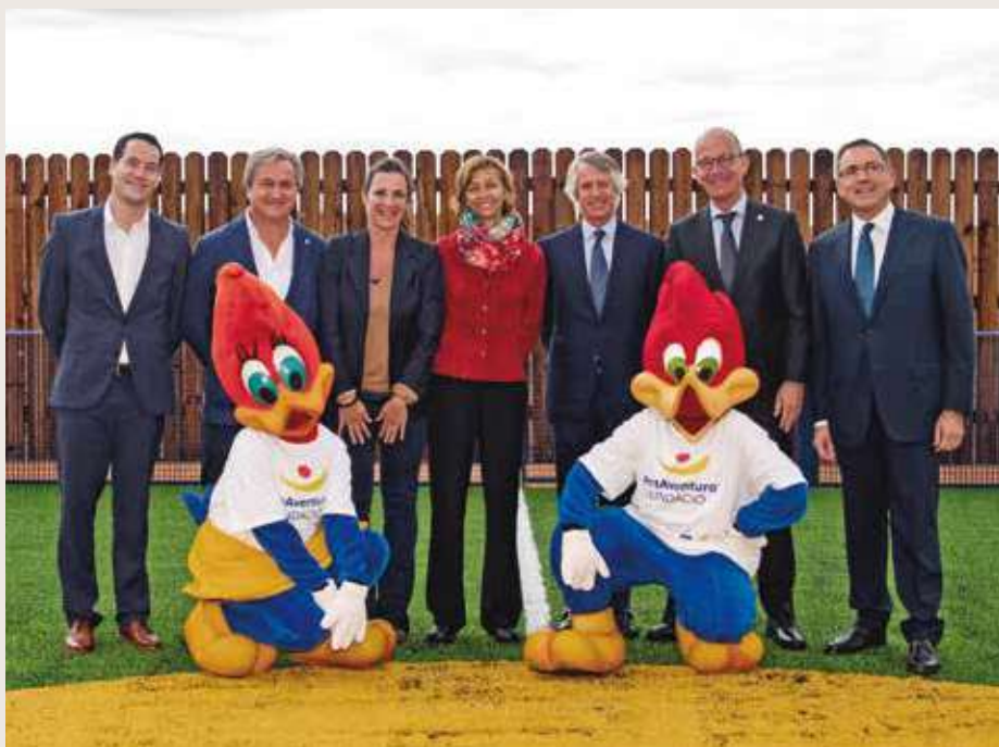
Representantes de la Fundación Barça, Fundación PortAventura y Cruyff Foundation.

La mejora del bienestar emocional de niños y niñas en situación de vulnerabilidad o de enfermedad es el objetivo conjunto de la Fundación Barça y la Fundación PortAventura, que firmaron un convenio de colaboración para trabajar en esta línea en el mes de octubre. Este acuerdo se focaliza en la realización de actividades dirigidas a estos colectivos; difundir y dar a conocer las actuaciones de ambas entidades en la programación de PortAventura Dreams; y la implementación de actividades lúdicoeducativas en un village ubicado en PortAventura World que buscará ofrecer una experiencia única a niños y jóvenes que sufren enfermedades graves y a sus familias.