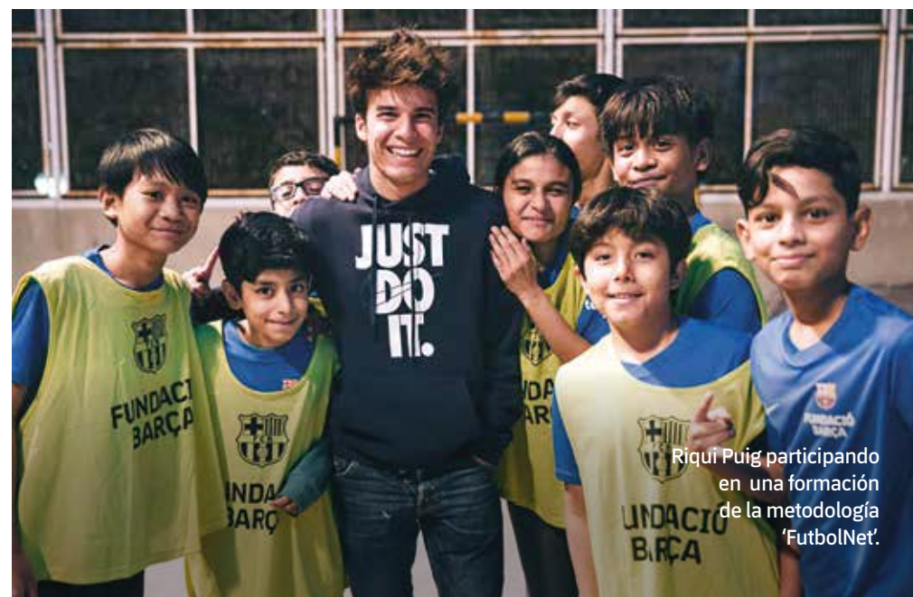
Riqui Puig participando en una formación de la metodología 'FutbolNet'.