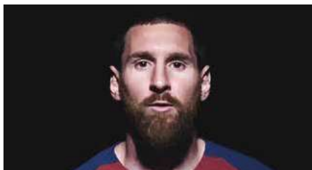
Imagen de Messi de la campaña conmemorativa.

Participa y gana en el Concurso Solidario contestando a este cuestionario de preguntas.